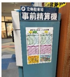
病院待合での掲示