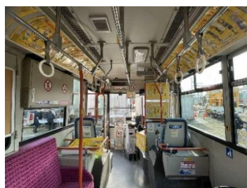
イベント時の配布、掲示(展示車両車内広告ジャック)