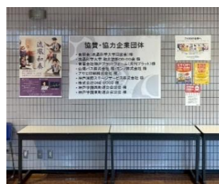
大学イベント会場での掲示