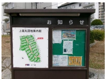
沿線団地掲示板での掲示