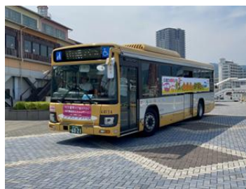
2025年7月 安全啓発パレード