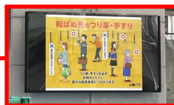
区役所サインージでの表示(期間限定)