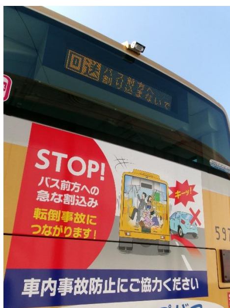
(安全啓発後部ラッピング)